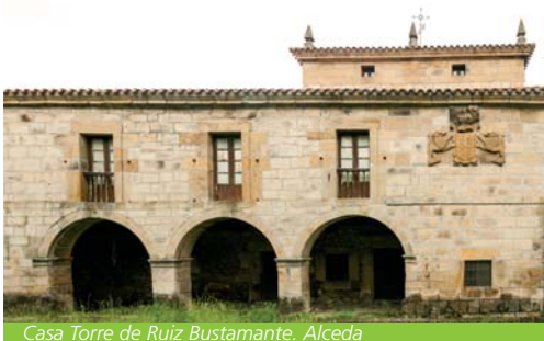
Casa Torre de Ruiz Bustamante. Alceda

lado el abandono de las torres como sistema de represión de los linajes más poderosos, apareciendo las casas-torre; y de otro lado la necesidad de mostrar, por la vía de la notoriedad arquitectónica, el carácter de hidalguía, lo cual era sinónimo de notables privilegios en la sociedad de la época. En esa idea proliferarán a partir del siglo XVI, en las casonas de hidalgo, los escudos de armas, como soporte o prueba esencial de la antigüedad de la familia y de su carácter noble.