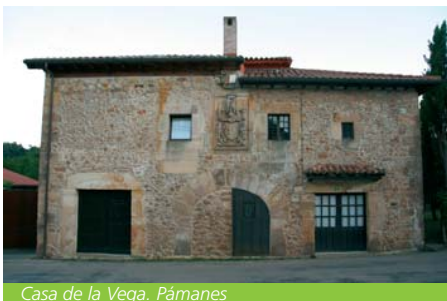
Casa de la Vega. Pámanes

De la misma época es la Casa del Intendente Riaño , que recibe el nombre de quien fuera Intendente de Guanajuato, en Méjico, y Caballero de la Orden de Alcántara. Se localiza en el barrio de La Costera de Liérganes y responde a un modelo habitual de la época tendente a formar un bloque cúbico, elemental, con un arco de medio punto de grandes dovelas, donde la influencia clasicista se aprecia en la distribución simétrica de los vanos en la fachada.