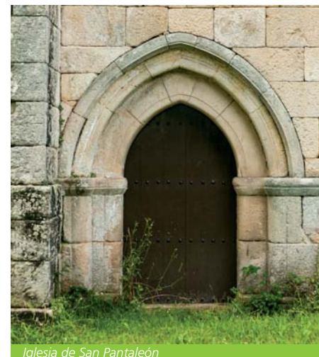
Iglesia de San Pantaleón

De carácter popular, destaca la combinación de elementos de distinta época, como la cabecera semicircular y los canchales con motivos geométricos de tradición románica y los aspectos propios de la estética gótica, como el ábside con bóveda de medio cañón y arco toral apuntados, apoyando en cimacios de doble fila de rombos y estrias horizontales o arquillos de herradura enmarcando hojas.