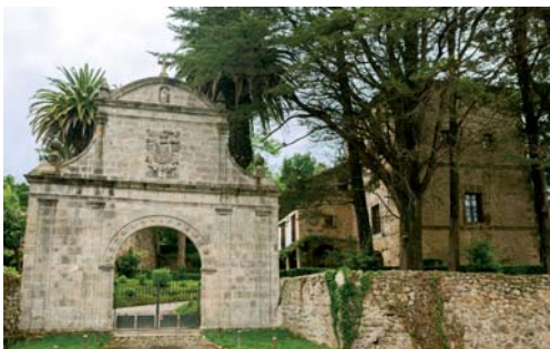
Casa Torre de Ceballos. Alceda