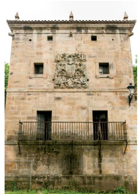
Torre de la casa de Bustamante Rueda en Alceda.

habitación y residencia del señor y su séquito, disfrutando en este caso de un tillado en madera. Como curiosidad conviene señalar que la estructura de madera sustentante de los dos suelos interiores, con vigas y postes, es independiente de los muros.