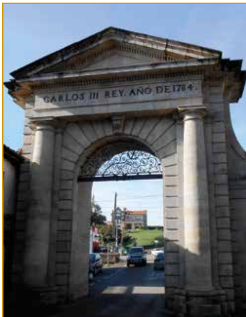
Arco de Carlos III (La Cavada-Riotuerto)

Se trata de una portada neoclásica, levantada en 1784, que conmemora a la persona del rey por su intervención en las fábricas de Santa Bárbara. Estas se dedicaban a la fabricación de cañones durante los siglos XVII y XVIII.