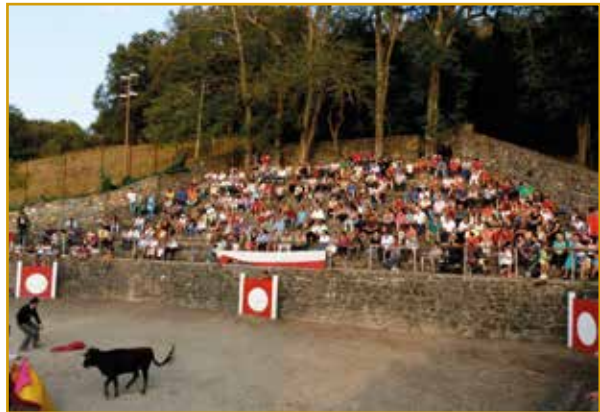
Plaza de Toros cuadrada (Rasines)

La Plaza de Toros de Rasines es la única de planta cuadrada existente en Cantabria y la más antigua de las que en la región se conservan. Data del siglo XVII y se halla situada al lado de la ermita de Los Santos Mártires San Cosme y San Damián.