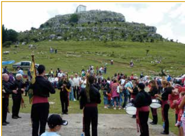
Fiesta de la Virgen de las Nieves. 5 de Agosto. Patrona del Valle de Guriezo

Cada 15 de agosto, con motivo de la celebración de la Virgen de Villasomera, se celebra en Rasines una novillada sin picadores. Poco tendría de particular la actividad de no llevarse a cabo en una de las dos únicas plazas de toros cuadradas conocidas en España. Se ubica junto a la Ermita de los Santos Mártires y fue construida en 1758.