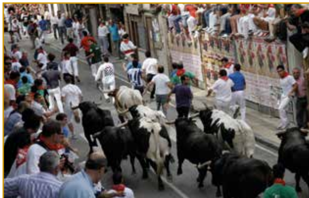
Encierros de Ampuero. Fiesta de Interés Turístico Regional (Ampuero)

Desde primeras horas de la mañana son muchas las personas que se acercan caminando desde los pueblos cercanos a Valle para acudir a las diferentes misas que se celebran en honor a la Virgen de los Milagros. También se puede disfrutar de un amplio mercado, actuaciones de música regional y para finalizar el día romería y verbena hasta altas horas de la tarde.