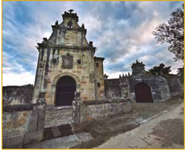
Palacio de Rugama. Bárcena de Cicero

Levantado para Lorenzo de Rugama a mediados del siglo XVIII, es uno de los edificios más representativos de la arquitectura señorial de Cantabria. Está compuesto por una casa-torre y una capilla-panteón dedicada a la Virgen del Carmen.