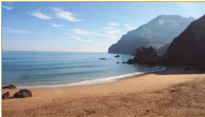
San Julián (Liendo)

Se encuentra situada entre agrestes peñas y bellos acantilados. Recibe el nombre de una cercana ermita y su longitud es de 285 m. Se accede desde el pueblo de Liendo, y después de 2 km de subida, donde dejaremos el coche, emprendemos un sendero que nos llevará hasta la playa. Desde los acantilados de San Julián, podremos divisar el macizo de Candina, donde está establecida la única buitrera marítima de Europa. Resulta un espectáculo único y sorprendente ver a estas aves sobrevolando el Cantábrico.