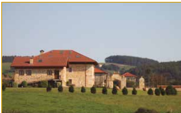
Patrimonio Civil Hazas de Cesto

Las construcciones civiles más interesantes se concentran en Beranga. Allí se pueden ver, entre otras, una torre de sillería del s.XVII, con un escudo de armas de los Isla; la Casa de los Villa, construida en el solar de Lucas de Villa en 1540 y reconstruida en el s.XVII; el Palacio de Villa, levantado en 1671 sobre los restos de una torre anterior, como consta en un documento que menciona a los maestros de cantería Juan de Solórzano, Pedro de Valle y Francisco Villa; la arruinada casa de Los Corro, en el barrio de las Agüeras, llamada así por haber pertenecido a los Corro, linaje procedente de San Vicente de la Barquera.