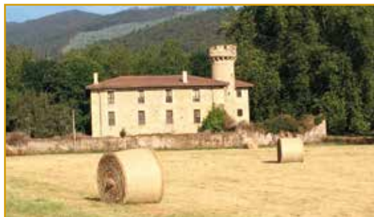
Ferrería de La Yseca (Guriezo)

El conjunto de la torre-palacio de la familia Fernández de Velasco se realizó en dos épocas, separadas por un tiempo cercano a los cien años. De una parte está la casa principal, construida a mediados del siglo XVII. Adjunta está la “casa-torre”, que data de 1782.