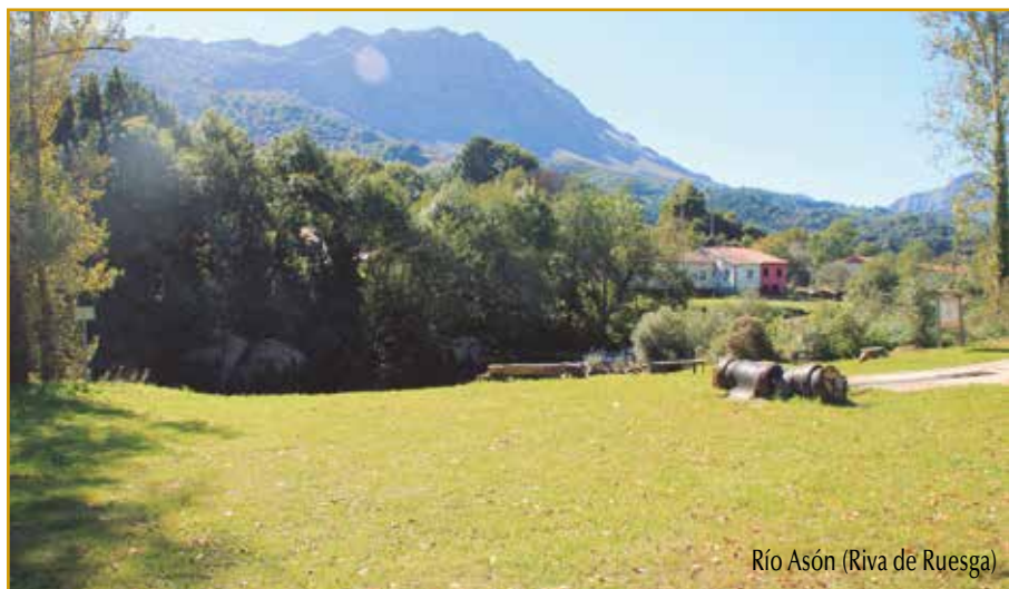
Río Asón (Riva de Ruesga)