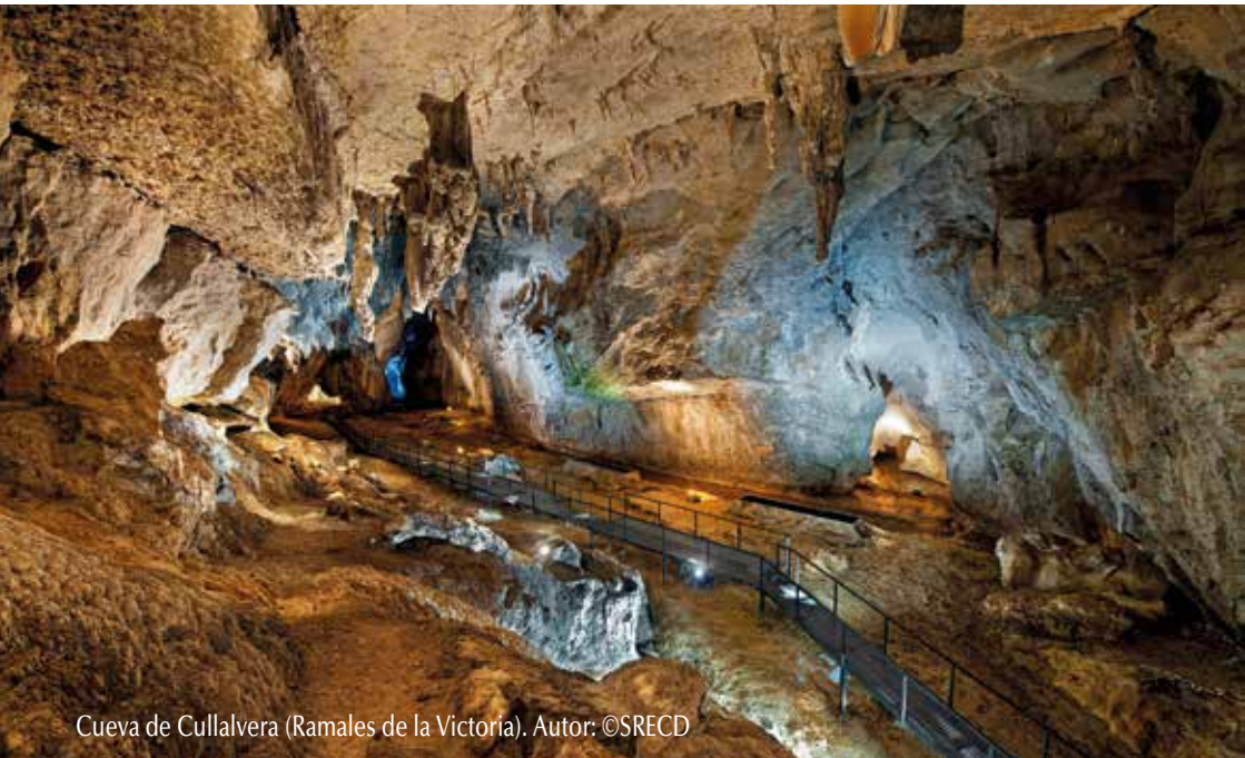
Cueva de Cullalvera (Ramales de la Victoria).

Muy especialmente, a las empresas colaboradoras y al personal técnico de turismo que las ha elaborado, ya que sin su apoyo y dedicación, estas publicaciones no hubieran sido posibles.