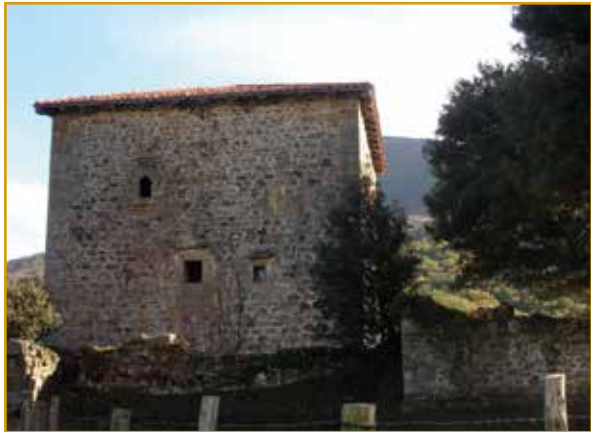
Torre de Quintana (Soba)

Es el edificio de más valor patrimonial del valle de Soba, declarado en 1992 Bien de Interés Cultural. La fundación de esta torre se relaciona con el linaje de los Velasco, una de las casas nobiliarias más importantes de la Cantabria oriental.