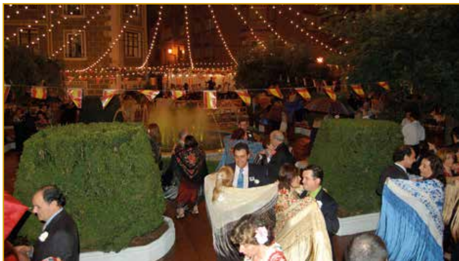
Verbena del Mantón. Fiesta de Interés Turístico Regional (Ramales de la Victoria)

Algunas versiones cuentan que el origen de esta verbena se celebra debido a que al finalizar la Guerra Carlista en 1839, los derrotados (carlistas) en su huida dejaron olvidado un baúl con Mantones de Manila, que el general Espartero del bando liberal entregó a las mozas ramaliegas para celebrar su victoria.