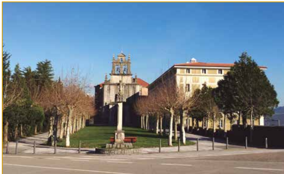
Santuario de La Bien Aparecida (Ampuero)