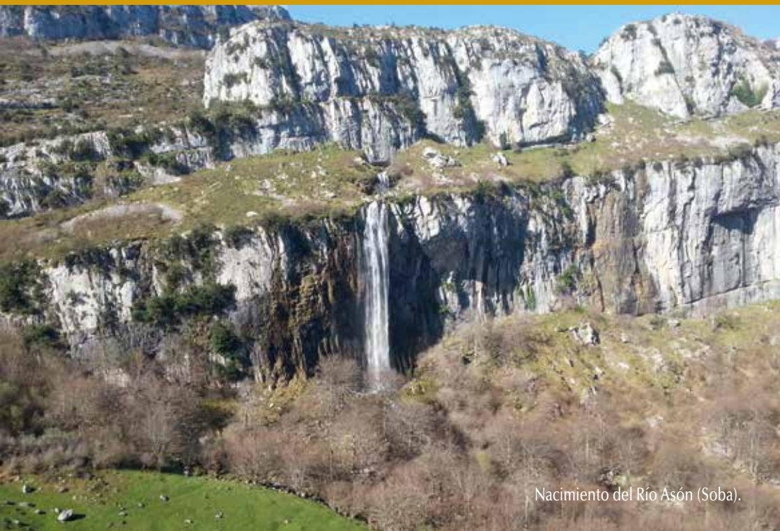
Nacimiento del Río Asón (Soba).

Estos son únicamente algunos de los tesoros de esta espectacular y rica Cantabria Oriental Rural, que les invitamos a descubrir.