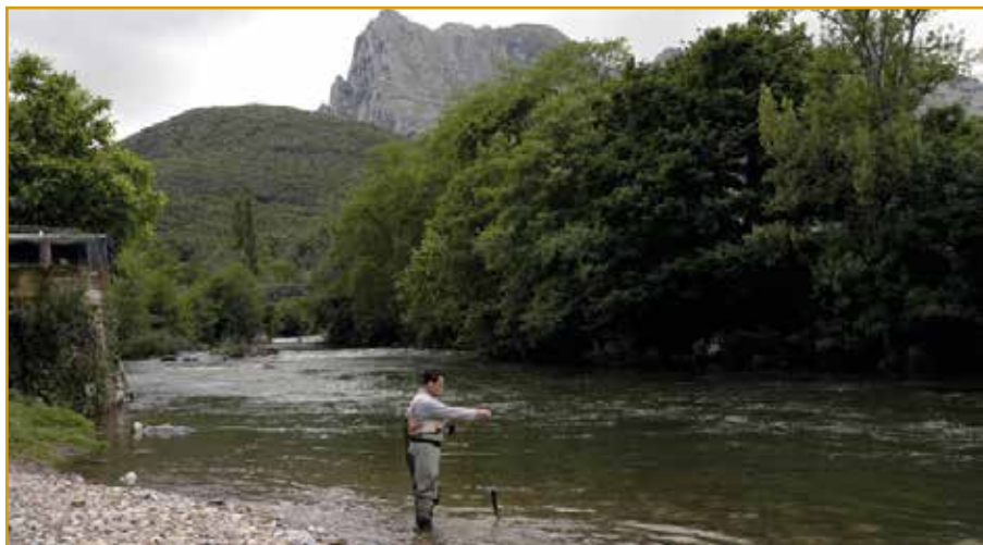
Pescador en el Río Asón (Ramales de la Victoria)

A lo largo de la historia los ríos Asón y Gándara han sido un eje importante en el desarrollo de la Comarca Asón-Agüera-Trasmiera. Sus aguas han sido utilizadas para el funcionamiento de Molinos, centrales eléctricas etc. Además es importante la función que tuvo el único puerto fluvial de Cantabria que existió en Limpias. Y debemos destacar la pesca, antiguamente como una forma más de subsistencia de los locales y en la actualidad como deporte que atrae cada año a los amantes de este deporte. El río Asón destaca por la cría de en sus aguas de la especie autóctona como el salmón y la trucha. En la actualidad, debido a los daños sufridos por esta especie es necesaria la repoblación, actuación que se lleva a cabo desde el Centro Ictiológico de Arredondo. La temporada de pesca comienza en el mes de abril, y el río Asón ha sido varios años el río donde se ha obtenido “el Campanu” primer salmón de grandes dimensiones y cuyo precio en el mercado suele ser elevado.