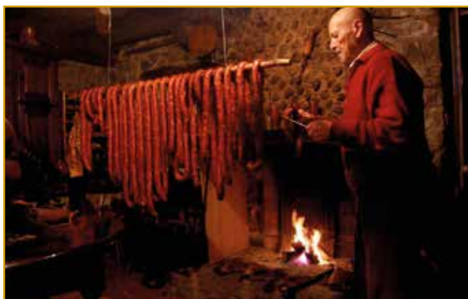
La Matanza del Cerdo (Soba)

También durante el mes de Noviembre se realiza en las zonas más rurales de la Comarca la tradicional Matanza del Cerdo. La fecha suele ser cercana a San Martín.