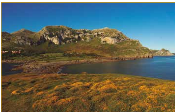
Vista de Sonabia (Liendo)

Rodeada por hermosas colinas, destacando un enorme peñón calizo, conocido como la Ballena por su perfil en forma de cetáceo. Esta playa escondida y de difícil acceso, esta coronada por salvajes dunas cubiertas de suave vegetación y vigilada por buitres leonados.