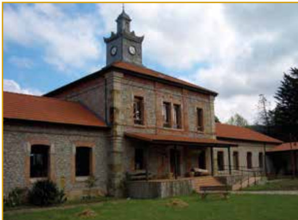
Antiguas Escuelas y Museo Etnográfico (Valle de Villaverde)

Al igual que en el resto de Las Encartaciones, sus construcciones indianas fueron levantadas por aquellos emigrantes del siglo XIX que regresaron al pueblo después de probar fortuna en América.