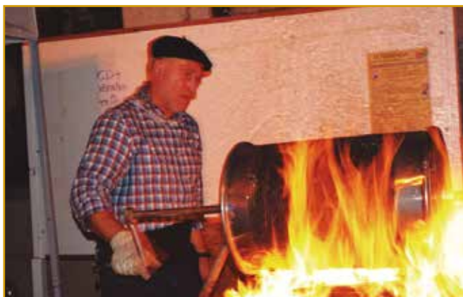
La Magosta en Ramales

En el mes de noviembre desde hace pocos años se representa en Ramales de la Victoria “La Magosta” recuperando la tradición casi perdida de asar castañas de modo tradicional con una hoguera, los visitantes que se acercan pueden degustar las castañas, producto que se de en la Comarca el otoño, además este evento está completando con música tradicional, concurso de ollas ferroviarias y diferentes actuaciones.