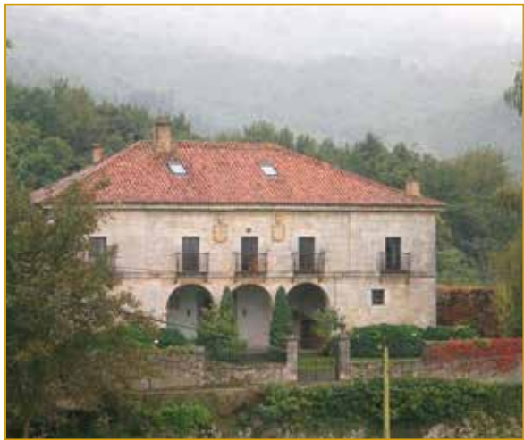
Casa de los Cerecedo de Alvear (Voto)

Se ubica en el Barrio de la Llana de la localidad de Solórzano. Se trata de una gran casona montañesa de estilo barroco, de mediados del siglo XVII y con elementos añadidos en etapas posteriores.