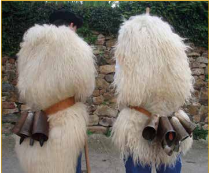
Marceros de Fresnedo (Soba)

Cada año, para celebrar la llegada de la primavera, el último día de febrero o el primero de marzo, los marceros salen a la calle para cantar las Marzas. Es habitual que los mozos de los pueblos se vistan con trajes típicos, y vara de avellano en mano, recorran las calles con sus alegres cánticos, recibiendo el cariño de los vecinos.