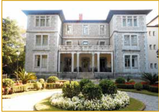
Palacio de Egulior, Parador de Turismo (Limpías)

El palacio perteneció al conde de Albos, Manuel de Egulior y Llaguno, que en el año 2004 fue convertido en Parador Nacional de Turismo. El palacio está situado en medio de una gran finca conocida con el nombre de El Castañar, de 50.000 metros cuadrados, en la que se puede encontrar una gran variedad de árboles y plantas.