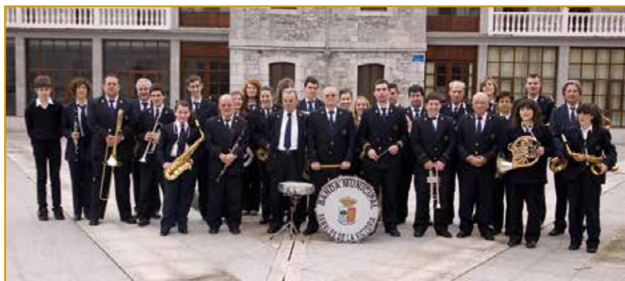
Banda Municipal de Música. Rames de la Victoria