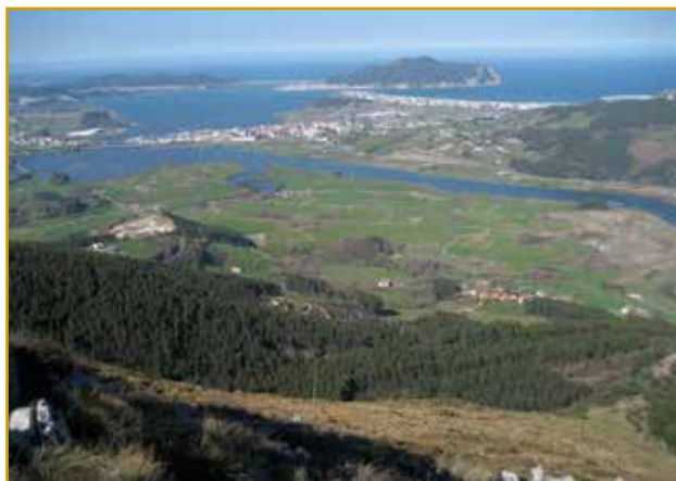
Vista del Parque Natural de las Marismas de Santoña (Voto-Limpías)

Parque Natural desde 2006, cuenta con una extensión de 6.979 hectáreas. El techo dentro del parque natural es la Peña Ganzo, situada en el monte Buciero, con una altura de 378 m. Este Parque también es reconocido como LIC (Lugar de Importancia Comunitaria) y como ZEPA (Zona Especial de Protección de Aves).