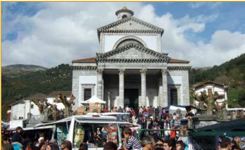
Fiesta de todos los Santos (Arredondo, “la Capital del Mundo”)

Por el pueblo, frente al ayuntamiento y en los alrededores de la Iglesia de San Pelayo se alojan gran profusión de tenderetes y baratillos, que atraen a una verdadera avalancha humana. En cuanto a la feria, destaca el ganado caprino, aunque también suelen mostrarse ovino y caballar. Considerada el mayor escaparate de ganado caprino de la cornisa cantábrica. Se calcula que, entre ovejas, cabras, asnos, vacas, caballos y alguna piara de cerdos, los animales superan el millar.