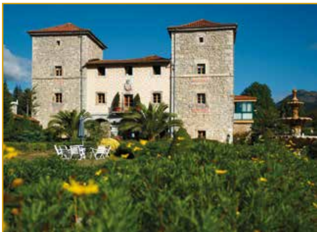
Palacio-Hotel "Torre de Ruesga"

Si algo llama la atención en este municipio es su gran riqueza patrimonial, sobre todo de carácter civil. Tierra de Indianos por excelencia, destaca la Casa de Federico Porres del Castillo, construida en Valle en el año 1902. Otros edificios de interés son la Casa de los Arredondo, que data del siglo XIV (Ogarrio), la Torre de los Arredondo situada en Riva, fundada por Hernán García de Arredondo y el Palacio Zorrilla San Martín, del siglo XVII.