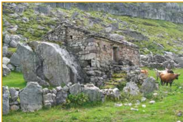
Cabaña en el Parque Natural Collados del Asón (Soba)

Fue declarado parque natural en 1999, está ubicado en el municipio de Soba, en plena Cordillera Cantábrica y cuenta con una extensión de 4.740 hectáreas.