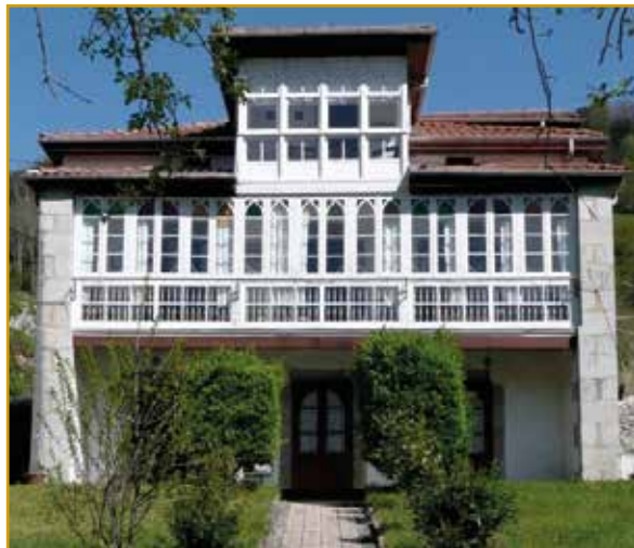
Casa de Indianos (Arredondo "La Capital del Mundo")