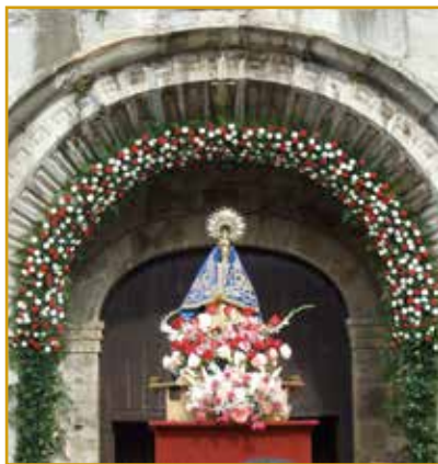
Festividad de la Bien Aparecida. Patrona de Cantabria (Ampuero)

Durante la primera semana de septiembre se celebran en Ampuero los tradicionales encierros, Fiesta de Interés Turístico Regional. Comenzaron a celebrarse en 1941 y que, al igual que en San Fermín, se inician con el chupinazo desde el balcón del Ayuntamiento