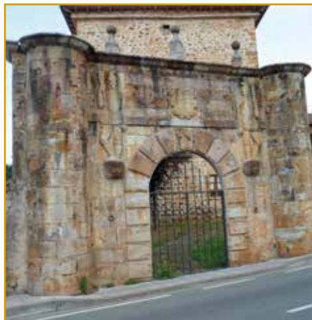
Portalada y Torre de Espina (Ampuero)

La Portalada de acceso es del siglo XVII, y en ella aparecen figuras de maceros, representando los héroes Hércules y Teseo, como gigantes, con sus mazas y pisando las cabezas de los leones. Actualmente la Torre acoge un museo dedicado a Juan de Espina y Velasco.