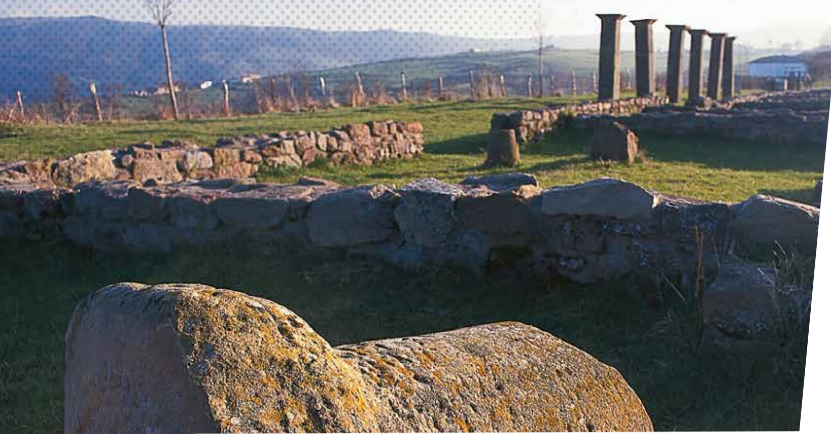
Ciudad romana de Juliobriga