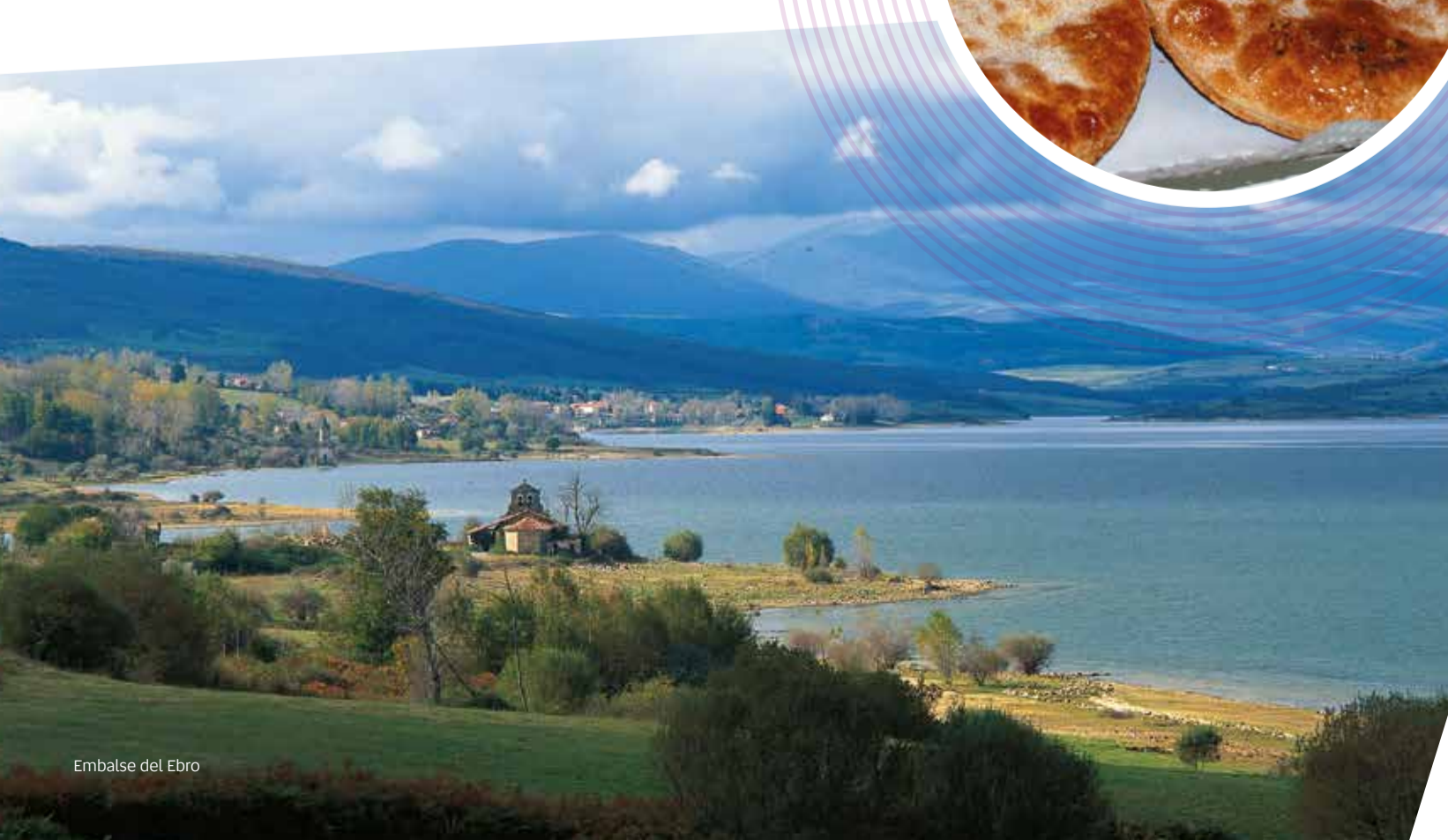
Embalse del Ebro

CENTRO DE VISITANTES DE LA PIEDRA EN SECO. La Puente del Valle (Valderredible) Dedicado a la modalidad de construcción típica de la zona. Cierra los lunes. En temporada baja, sólo fines de semana. Rutas y actividades, bajo reserva. (+34) 900 649 009. cima.cantabria.es