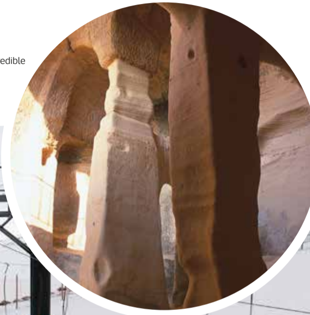
Iglesia rupestre de Valderredible

Experiencia: Poblado Cántabro de Argüeso. Talleres familiares donde aprenderás a fabricar pan, técnicas de caza, cerámica, excavación arqueológica, música en la prehistoria, telares, cuerdas y nudos... (+34) 630 79 19 06 http://pobladocantabrodeargueso.blogspot.com