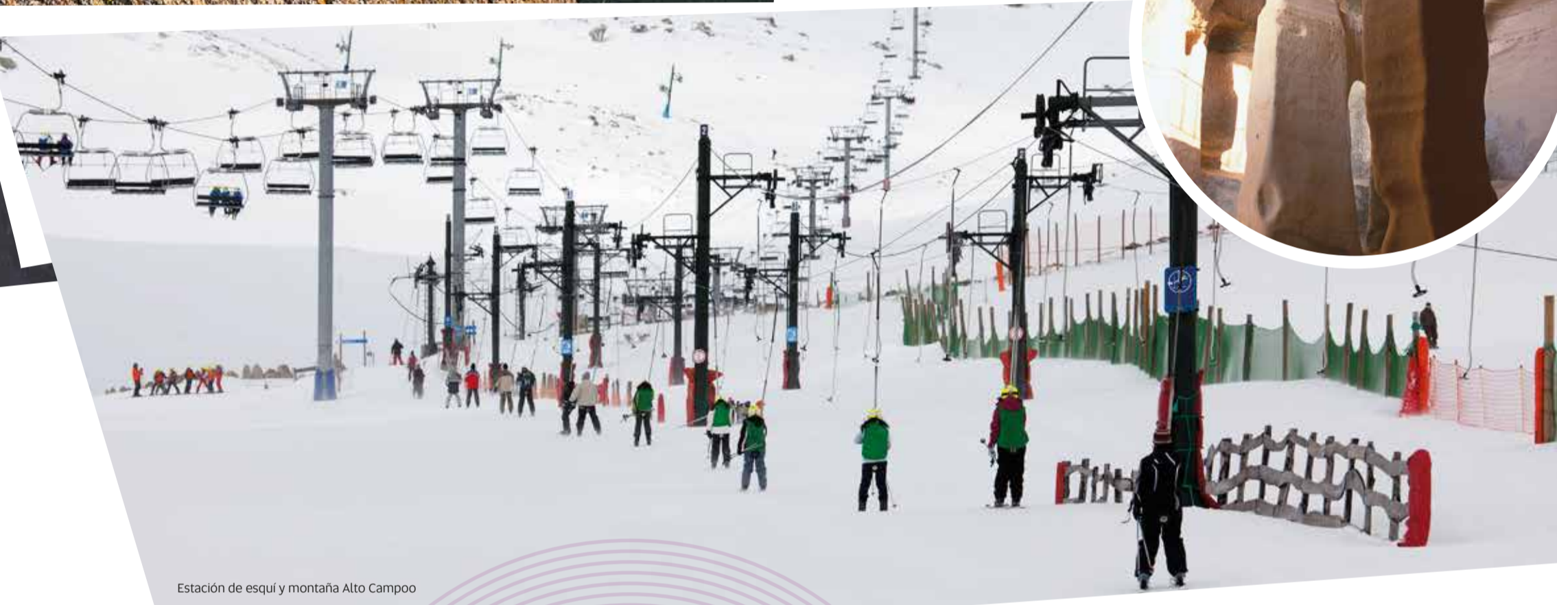
Estación de esquí y montaña Alto Campoo