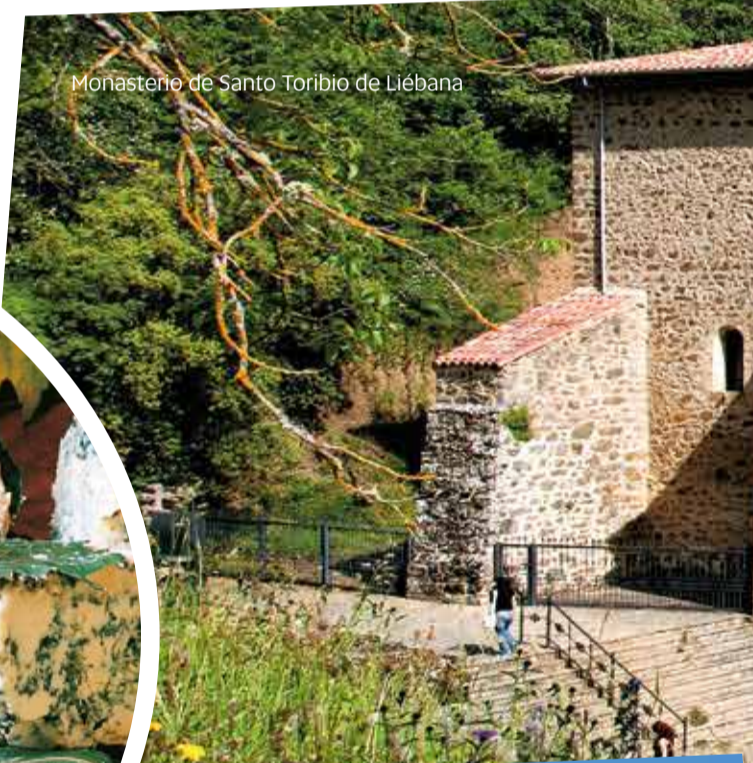
Monasterio de Santo Toribio de Liébana

Liébana está "benedicida" por un microclima templado y poco lluvioso, que le convirtió en destino idóneo para el refugio de los cristianos huidos de la invasión musulmana en el siglo VIII. Una de sus reliquias, el Lignum Crucis, se guarda en el Monasterio de Santo Toribio, donde tiene lugar el Año Santo Lebaniego siempre que el 16 de abril coincide en domingo. Otros espléndidos ejemplos de arte religioso se encuentran en Santa María de Lebeña, de estilo mozárabe, en Santa María de Piasca, monasterio dúplice de estilo románico, o San Jorge de Ledantes, adornada con hermosos frescos renacentistas.