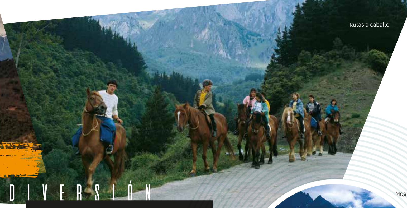
Rutas a caballo