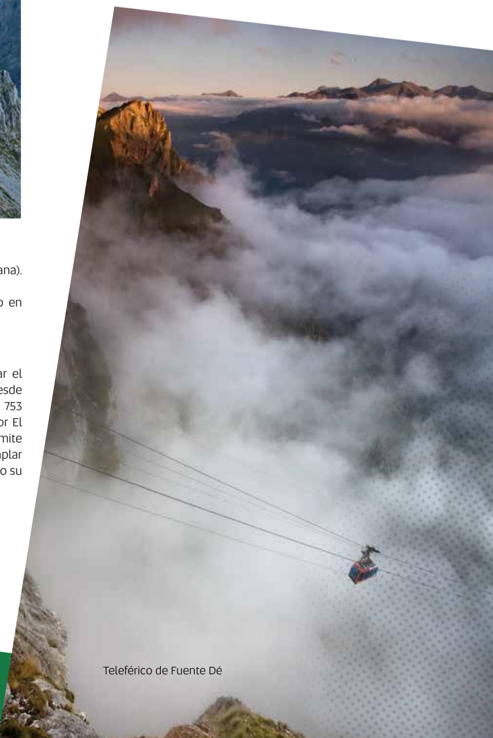
Teleférico de Fuente Dé

Otros centros son la Casa del Oso en Potes, la Casa de la Naturaleza en Pesaguero, el Parque de agua en Aniezo, o los Telares en Cabezón de Liébana, con distintas exposiciones y actividades sobre la etnografía y la naturaleza en Liébana. www.comarcadeliebana.com