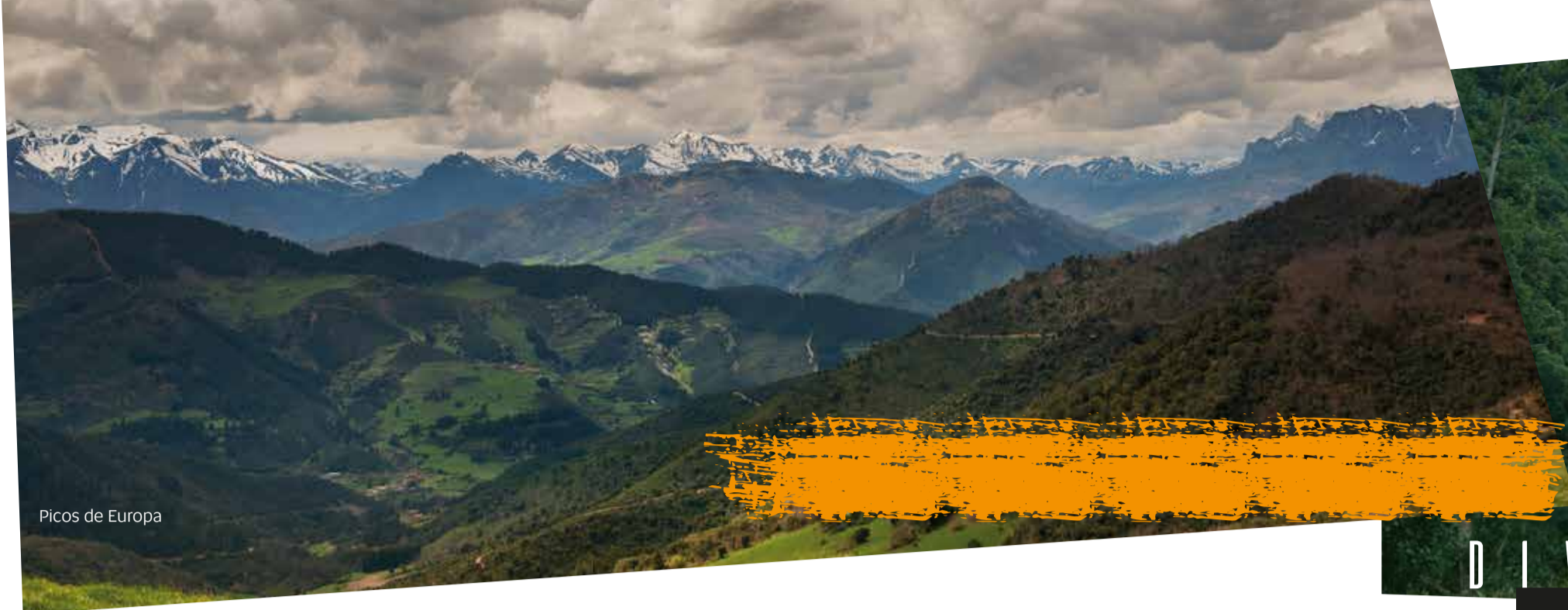
Picos de Europa