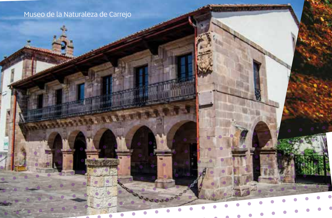
Museo de la Naturaleza de Carrejo

En en la carretera CA-135 que une Cabezón con Comillas se encuentra el Monumento Natural de las Secuoyas del Monte Cabezón . Regálale un agradable paseo por el bosque para disfrutar de árboles que pueden alcanzar más de 50 metros de altura y una longevidad de hasta 3.000 años.