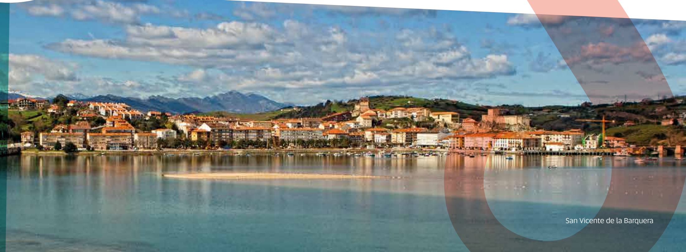
San Vicente de la Barquera

Noviembre. Fiesta de la alubia y la hortaliza en Cabezón de la Sal. ITR