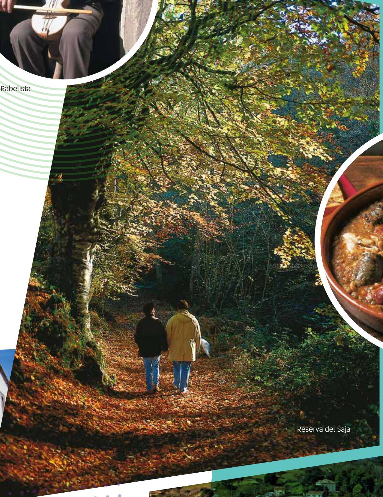
Reserva del Saja