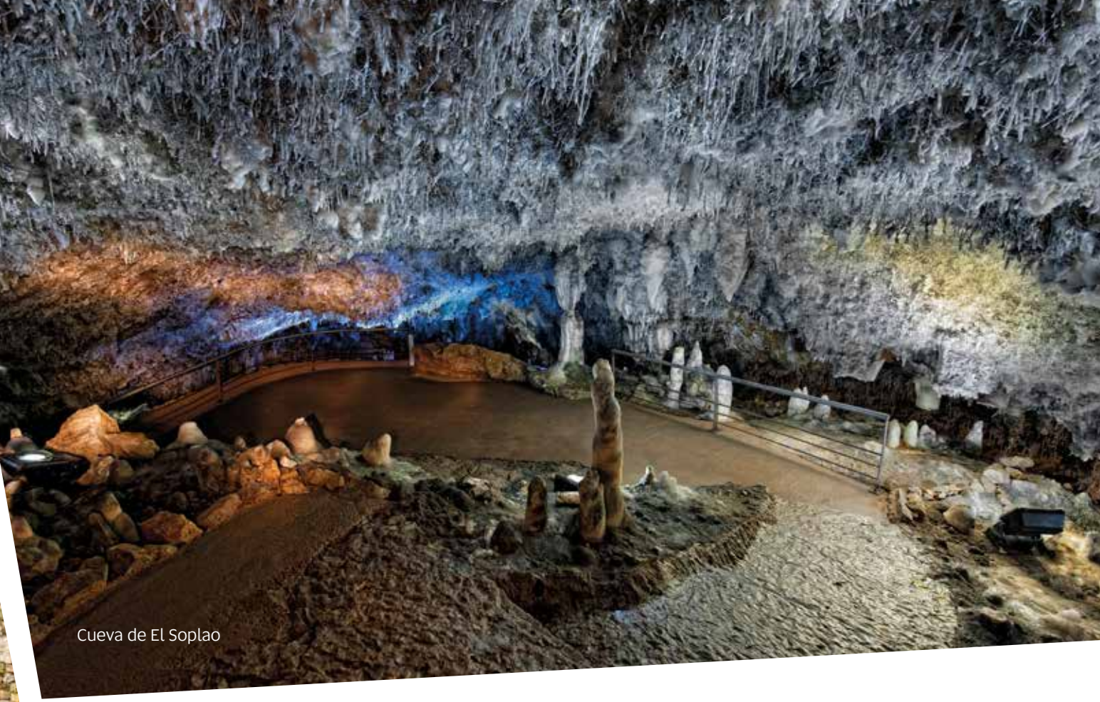
Cueva de El Soplao