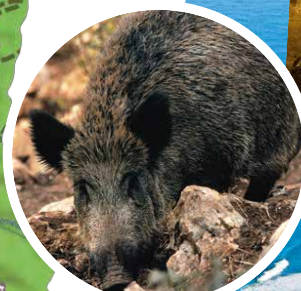
Jabalí. Reserva del Saja