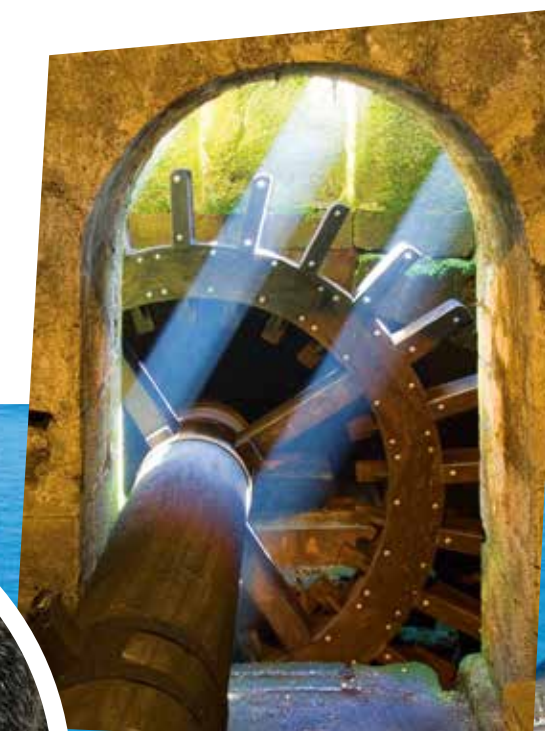
Ferrería de Cades