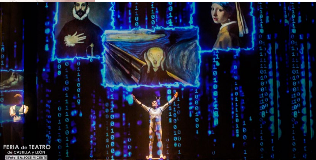
FERIA de TEATRO de CASTILLA y LEÓN

Público familiar recomendado de 6 a 11 años