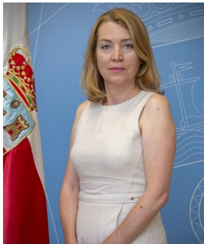
EVA GUILLERMINA FERNÁNDEZ Consejera de Cultura, Turismo y Deporte

Fiel a su cita con un público fiel y entusiasta, acude un año más, el Festival de Invierno que hace de la capital del Besaya, uno de los centros de referencia de las artes escénicas no solo en Cantabria, sino en el resto del país.