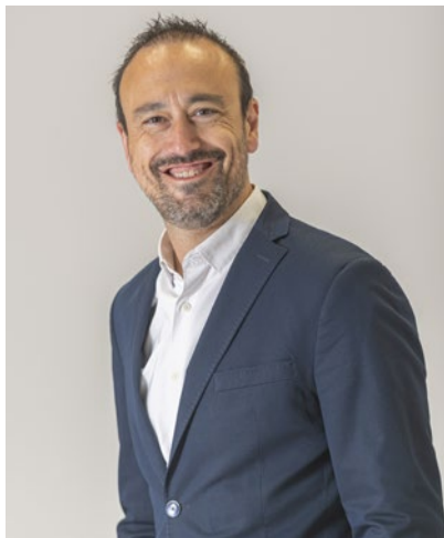
JAVIER LÓPEZ ESTRADA Alcalde de Torrelavega

Quiero aprovechar estas líneas para agradecer el trabajo de todas esas personas que están detrás de cada edición del Festival de Invierno, sin ellos, no sería posible. Y para invitaros a todos a acercaros al Teatro Municipal Concha Espina, a Torrelavega, y vivir en primera persona la 35ª edición del Festival de Invierno de Torrelavega.